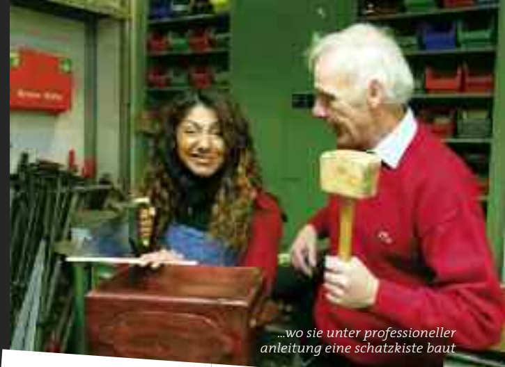
...wo sie unter professioneller Anleitung eine Schatzkiste baut

Jetzt im Moment habe ich eigentlich gar keine