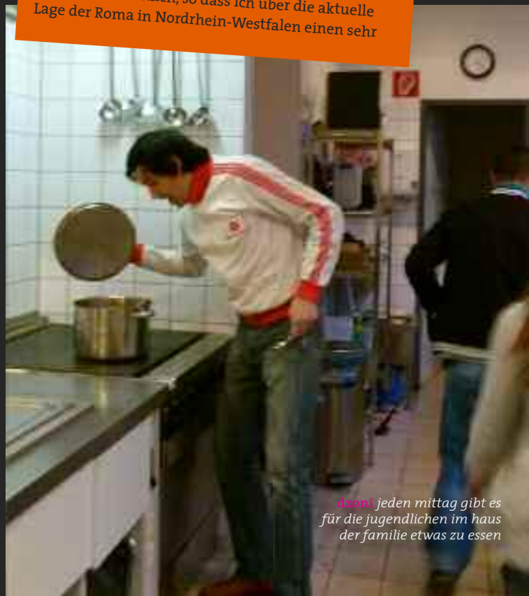
Dzoni jeden mittag gibt es für die jugendlichen im haus der familie etwas zu essen

In der Zeit habe ich auch bei Rom e.V. in Köln gearbeitet, ehrenamtlich, so dass ich über die aktuelle Lage der Roma in Nordrhein-Westfalen einen sehr