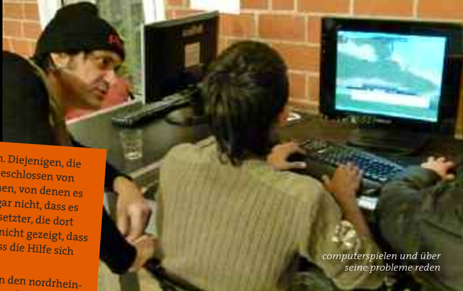
computerspielen und über seine probleme reden

erzählt sie sollten alle das Land verlassen. Diejenigen, die dort geblieben sind, die waren total ausgeschlossen von jeder Hilfeleistung. Die Hilfsorganisationen, von denen es jede Menge im Kosovo gab, die wussten gar nicht, dass es solche Roma-Enklaven gab. Und die Übersetzer, die dort gearbeitet haben, haben ihnen natürlich nicht gezeigt, dass es dort auch Roma-Siedlungen gibt. So dass die Hilfe sich nur auf die Albaner konzentrierte.