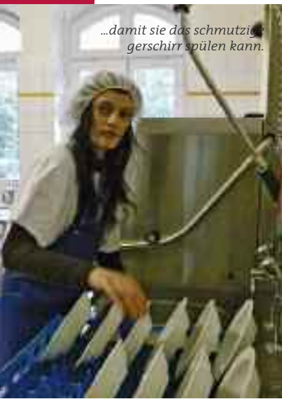
...damit sie das schmutzige Geschirr spülen kann.